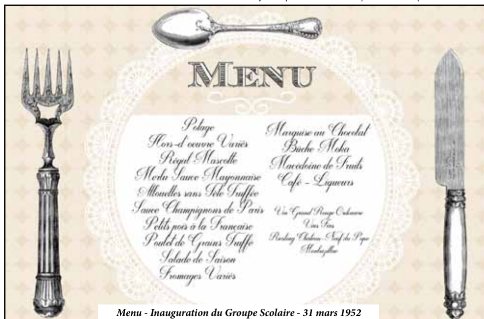
Menu - Inauguration du Groupe Scolaire - 31 mars 1952

A partir de 2014, un programme de sécurisation des abords du Groupe scolaire est entrepris. La 1 ère tranche s'est traduite par la création d'un parking ; elle sera poursuivie cette fin d'année par son extension jusqu'au complexe sportif. Et,