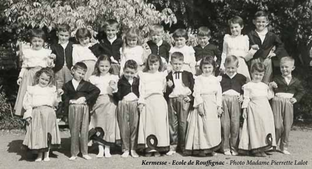
Kermesse - Ecole de Rouffignac