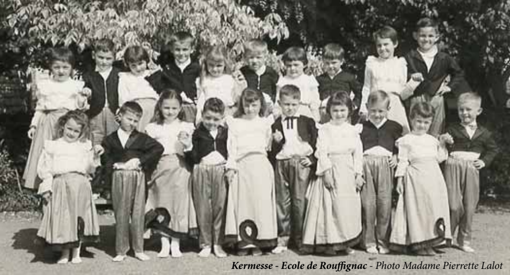
Kermesse - Ecole de Rouffignac

dant la durée des travaux, les élèves suivront la classe, pour les filles au château du Cheylard et pour les garçons au manoir de Tourtel, que les propriétaires respectifs avaient mis à disposition de la commune en la circonstance. En janvier 1952, l'Amicale Laïque est constituée par Monsieur Bertin, le directeur, et devient le partenaire privilégié de l'école ; rôle essentiel qui perdure de nos jours.