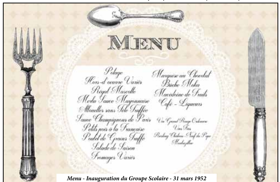
Menu - Inauguration du Groupe Scolaire - 31 mars 1952

A partir de 2014, un programme de sécurisation des abords du Groupe scolaire est entrepris. La 1 ère tranche s'est traduite par la création d'un parking ; elle sera poursuivie cette fin d'année par son extension jusqu'au complexe sportif. Et,